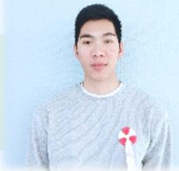
1. ごー まいん ていん (べとなむ / 東浅川) わたし ささ ことば 私を支えた言葉